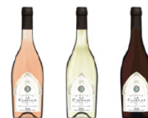
Domaine La Castille

En pratique : vente en semaine à l'accueil et à la sortie des messes dominicales -par cartons de 6 bouteilles (possibilité de mélanger vin rouge, vin blanc et vin rosé), au prix de 42 € (7 € la bouteille, prix officiel du Domaine). – Règlements : cartes bancaires, espèces ou chèques à l'ordre de « SAS Castille Sélection ».